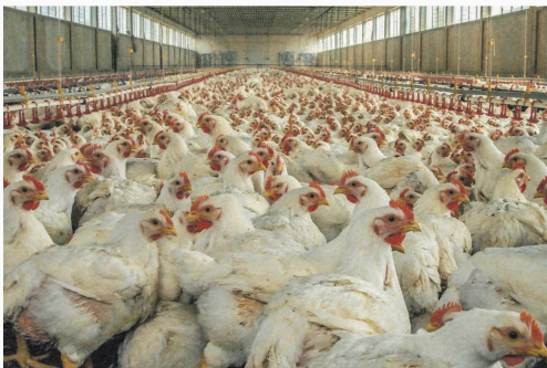
Een pluimveehouderij in de Italiaanse Po-vallei.