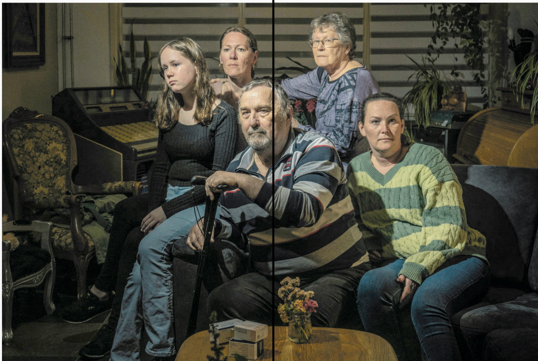
Een familie in Eindhoven waarvan drie generaties Q-koorts hebben gekregen.