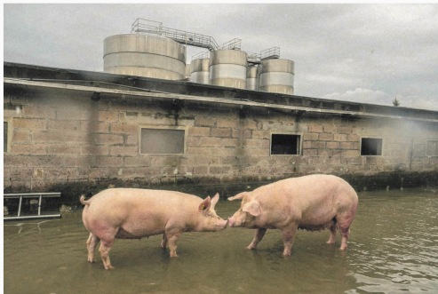
Een varkenshouderij in Lugo, Italië.