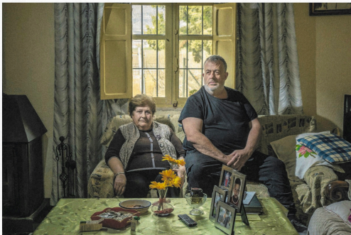
Inwoners van het Spaanse Lorca lijden ernstig onder de intensieve veehouderij.