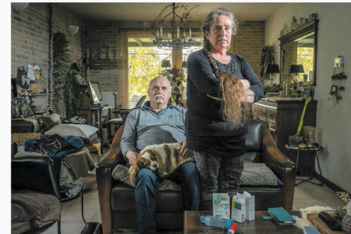
Ans uit Brabant wijt haar toegenomen astmakiachten aan de veehouderij in haar omgeving.