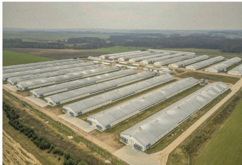
De intensieve pluimveehouderij in het Poolse Zuromin drukt zwaar op de regio.