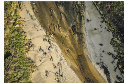
Het water van een varkensboerderij kleurt een beek in het Franse Landuvez bruin.