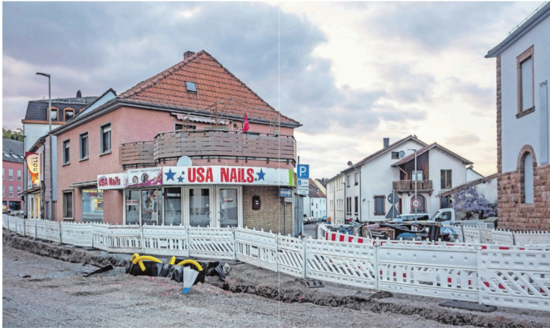
USA Nails-studio in de Kaiserstraße in buurgemeente Landstuhl.

Zo zou de Duitse federale regering het puntlicht niet verwoorden, maar Martina heeft wel een beeld: Europa kan niet zonder Amerikaanse militaire slagkracht. Dat legde Patrick Keller, analist veiligheid en defensie bij de toonaangevende Duitse denktank DGAP eerder deze maand nog eens uit. De grootste bedreiging voor Europese veiligheid, zegt Keller, is Poëties Rusland. En het is volstrekt onmogelijk om dat land af te schrikken of te bestrijden zonder de VS. Keller: 'Grootschalige, conventionele oorlogsvoering vereist