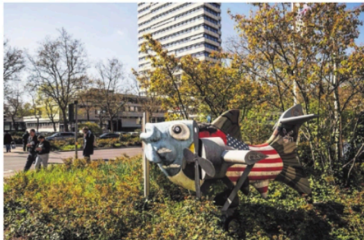
Bij het Deutsch-Amerikanisches Bürgerbüro in Kaiserslautern.

vollig geïntegreerde wapensystemen en eenheden, onder één commando-structuur, voorzien van communicatiesystemen en batifield intelligence gedragen door eigen satelliet-systemen. Rusland heeft dat. De VS hebben dat. China is hard op weg. Europa moet op al die vlakken een enorme inhaalslag maken. En zijn niet eens begonnen te plannen voor een verdediging zonder de VS.'