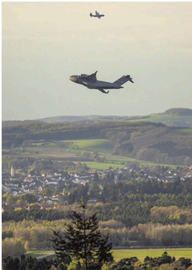
Militaire vliegtuigen boven de Amerikaanse luchtmachtbasis Ramstein in Duitsland.